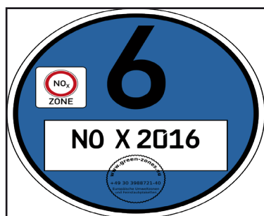
So soll die neue blaue Plakette aussehen

Im Regierungsbezirk Köln wären von den strengen blauen Umweltzonen voraussichtlich die Großstädte Köln, Bonn und Aachen betroffen. Grenzwertüberschreitungen gab es allerdings auch in den Städten Düren, Hürth und Overath. Insbesondere an verkehrsbelasteten innerörtlichen Straßen wurde hier der EU-Grenzwert von 40 µg/m 3 überschritten – insgesamt an 16 von 27 Messstationen. Die Gefahr ist also durchaus real. Im Interesse der Klimaschutzziele wäre es allerdings kontraproduktiv, vom aktuell