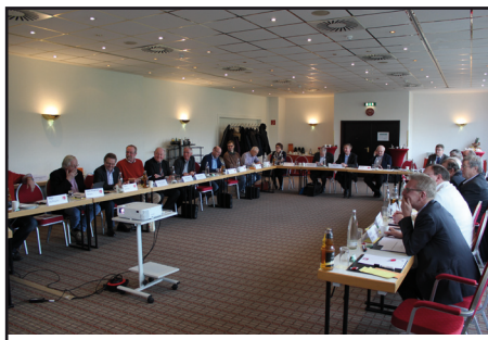
Fraktionsmitglieder von CDU und SPD bei der gemeinsamen Tagung

Neben Konzentrationszonen für Windenergie, die im neuen Regionalplan festzulegen sind, beschäftigten sich die Fraktionen mit Experten aus den Bereichen Wohnungswirtschaft, Tourismus, Wirtschaft sowie wissenschaftlichen Trends in der Regionalplanung. Hier wurde eine gute Grundlage für das weitere Verfahren und die anstehenden Gespräche mit den Kommunen gelegt.