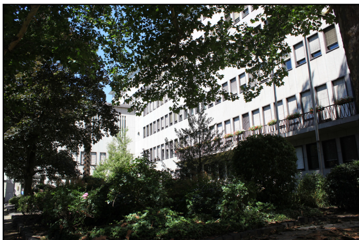
Der Hauptsitz der Bezirksregierung Köln in der Zeughausstraße.

Naturgemäß braucht eine neue Landesregierung, gerade dann, wenn sich die politischen Mehrheiten geändert haben, immer eine gewisse Zeit, bis es rund läuft. Tatsächlich waren daher die ersten Monate auch davon geprägt, sich zu finden und die neuen Gesichter auf der anderen Seite in den neuformierten Ministerien kennenzulernen. Jetzt läut