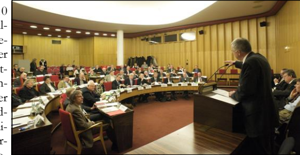
Konstituierende Sitzung des Regionalrates in der IHK

In der Sitzung des Regionalrates wurden zudem die Kommissionen der nächsten Wahlperiode gewählt. So wird es eine Verkehrskommission mit den Unterkommissionen Ville-Eifel, Rhein-Berg und