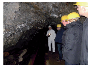
Bergstollen der Grube Wohlfahrt