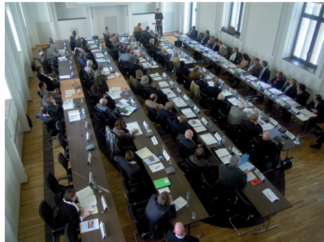
Der renovierte Plenarsaal der Bezirksregierung Köln

die nach zweieinhalb Jahren wieder „nach Hause“ kommen durften.