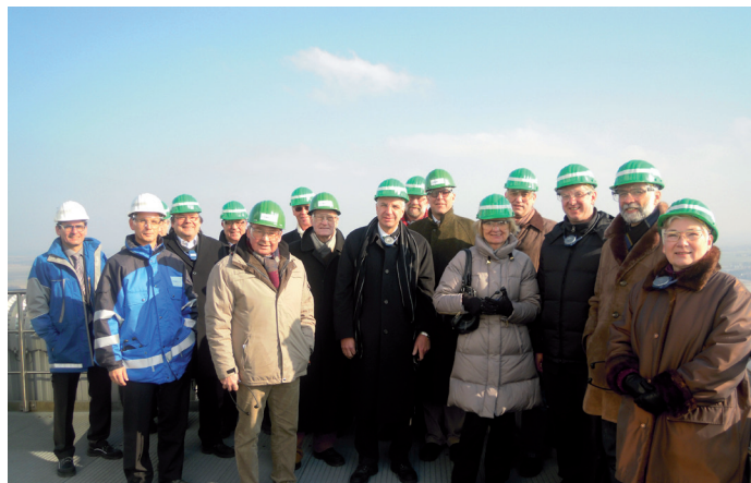
Die CDU-Fraktion in 172m Höhe auf dem BoA-Block 1

Neben Vorträgen und der konkreten Erläuterung an einem großflächigen Standortmodell bekamen die Mitglieder der Fraktion bei einer anschließenden Führung einen umfassenden Eindruck des gesamten Werkgeländes. Unter anderem konnten die Anwesenden in 172m Höhe bei guten Sichtverhältnissen einen Blick auf die für das Kraftwerk BoAplus vorgesehene 23ha große Fläche werfen. Der Regionalrat wird sich voraussichtlich in der Juni-Sitzung wieder mit dem Vorhaben BoAplus beschäftigen. Bis dahin sind allerdings noch entscheidende Fragen bezüglich Stilllegung, Rückbau und Abriss alter Kraftwerksanlagen an den Standorten Frimmersdorf und Niederaußem zu klären. RWE wird am Standort Niederaußen noch in 2012 die 150MW-Anlagen ab-