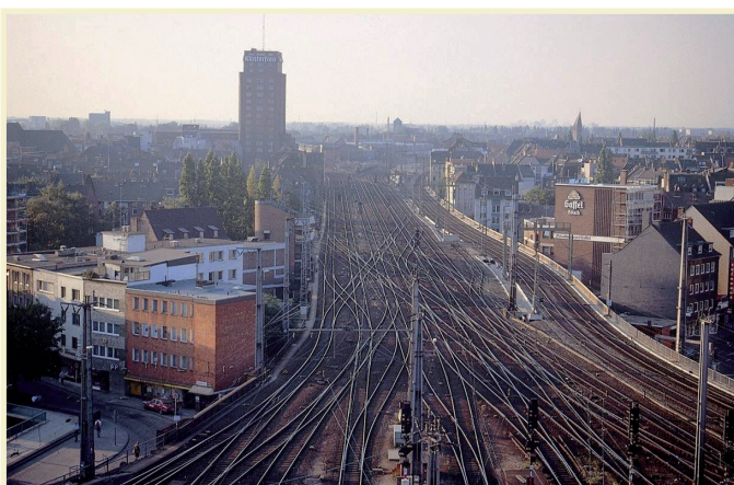
Eng und überlastet: Die Zufahrt zum Kölner Hbf vom Westring

schon jetzt an seine Kapazitätsgrenzen. „Die Situation am Knoten Köln mit all seinen Auswirkungen auf die umliegende Region und darüber hinaus ist mehr als grenzwertig, ein Ausbau zwingend notwendig“, mahnt