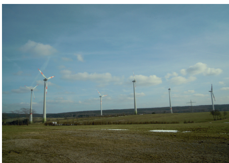
Der südlichste Windpark NRWs auf Hellenthaler Gemeindegebiet

Die südlichste Gemeinde Nordrhein-Westfalens war in diesem Jahr Ort der Klausurtagung des Vorstands der CDU-Fraktion im Regionalrat Köln. Am 09. und 10. März wurde das Thema Windenergie auf der Tagung in Hellenthal diskutiert.