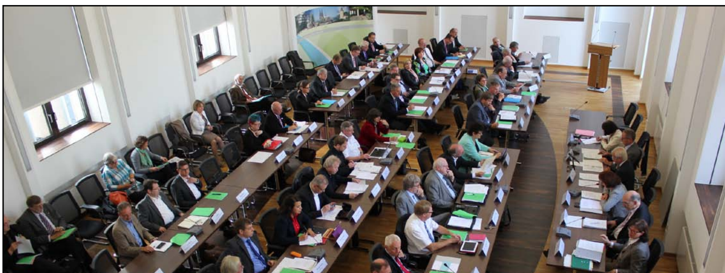
Der gefüllte Plenarsaal der Bezirksregierung Köln bei der Konstituierung des Regionalrats am 19. September