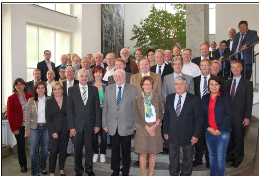
Der neu konstituierte Regionalrat Köln für die Sitzungsperiode 2014 - 2020 besteht aus insgesamt 44 stimmberechtigten Mitgliedern