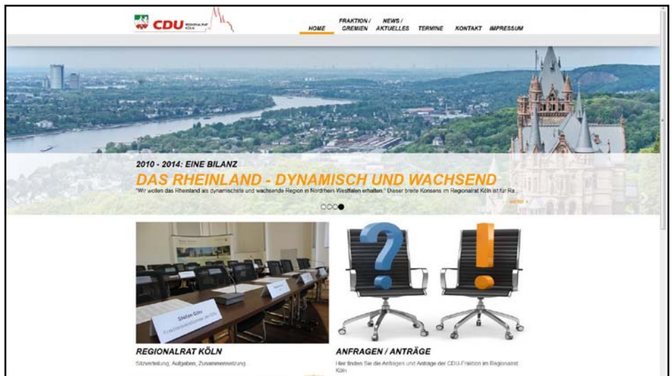
Die Homepage der CDU-Fraktion im Regionalrat Köln im neuen Gewand

Zudem ist Homepage der Fraktion jetzt „responsive“. Egal auf welchem Endgerät die Seite angeklickt wird (PC, Laptop, Tablet, Smartphone), die Seite wird immer in der optimalen Größe und Auflösung